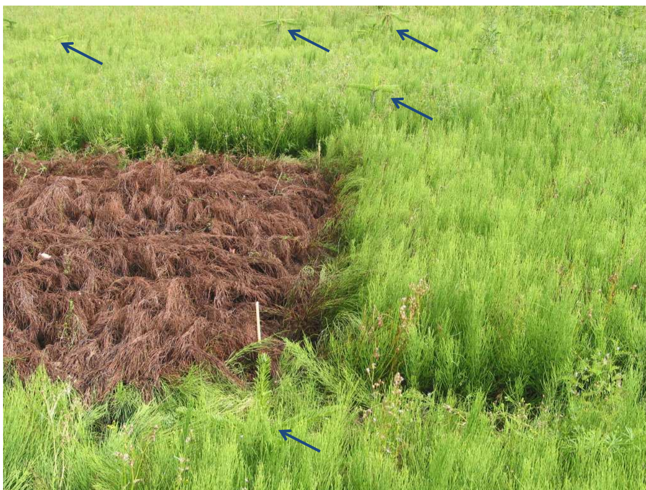
Til venstre er padderokkerne sprøjtet med MCPA og til højre med Roundup. Forrest og bagest i billedet er ubehandlet. Bemærk nordmannsgran, der stikker op hist og her (pile).

Institut for Agroøkologi ved Aarhus Universitet i Flakkebjerg har i 1993, 1998 og 2002 testet mere end 30 nyere herbiciders effekt overfor agerpadderok, men ingen har tilnærmelsesvis haft samme gode virkning som det velkendte hormonmiddel MCPA. I øjeblikket (2015) er der 5 MCPA produkter godkendt til mindre anvendelse i pyntegrønt og juletræer, men ingen til løvtræ i skov. MCPA er foreløbig er godkendt til 2018. Det er ikke selektivt i vedplanter, og skal derfor anvendes afskærmet, så kulturplanterne ikke rammes. Der må maksimalt anvendes 750 gram aktivstof, svarende til 1,0 liter pr. hektar.