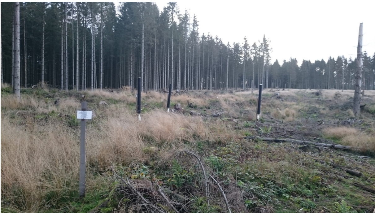
Figur 2. Tre steder i landet blev flyvningen af typograf fulgt ved fangst i tre feromonfælder. Her i Bommerlund plantage i Sønderjylland.