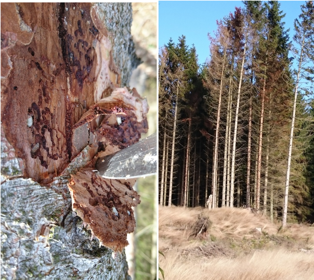
Figur 4. Der var kun få eksempler på angreb på stående træer i løbet af sommeren. Hér ses pupper på samme træ som de nyklækkede voksne (figur 3). Frøslev Plantage 23. oktober.