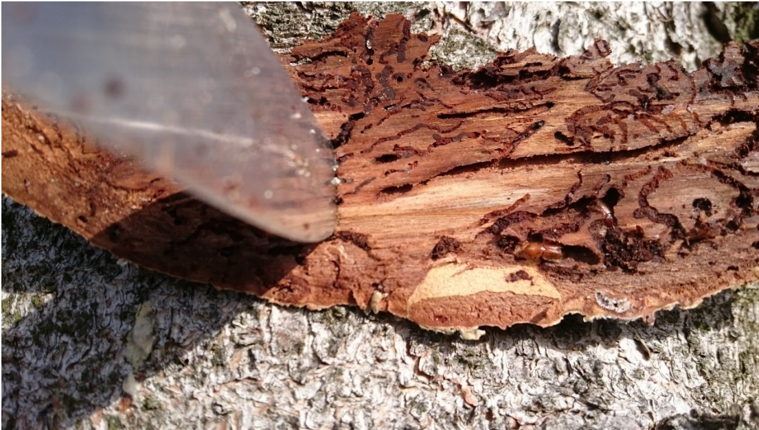
Figur 3. Den nye generation var sent udviklet. Hér ses nyklækkede lyse typografer 23. oktober, Frøslev Plantage.