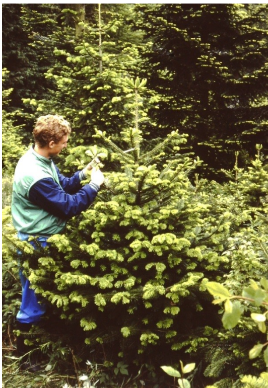
Få nærkontakt med træerne og tæl bladlus-hunner på skud, før beslutningen om bekæmpelse træffes.

Bekæmpelse af almindelig ædelgranlus er mest aktuel de sidste tre år af en kulturs omdriftsalder, da skader opstået før dette tidspunkt, vil kunne udbedres og nye nåleårgange vil dække over eventuelle tidlige nåletab. Senest lige før knopbrydning – som regel i midten af maj – bør man undersøge træerne for tætheden af ædelgranlus. Hvis det er første gang kulturen bedømmes, kan man med fordel gennemgå flere rækker eller – hvis arealet er jævnt og ensartet - gå diagonalt gennem området.